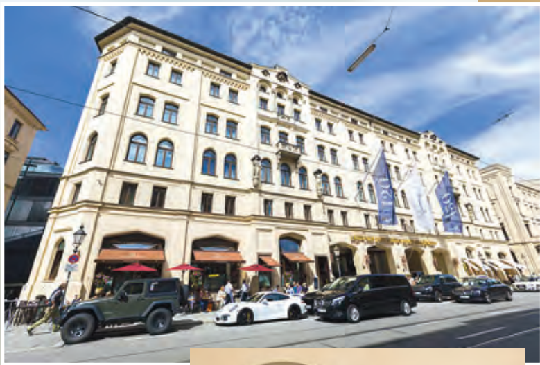
Hotel Vier Jahreszeiten Kempinski München, HKLS Installation, Heizung, Klima, Luft, Wärme, Sanitär, Wasser

Das Know-how des Spezialisten für Großprojekte ist aber auch bei Hotelsanierungen und -umbauten gefragt. Das Hotel Vier Jahreszeiten Kempinski ist die erste Adresse in München, wenn es um dezenten Luxus geht. Im Zuge der Neugestaltung von 60 Hotelzimmer und