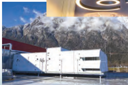
Die Lüftungsanlage mit einer Umwälzleistung von 60.000 m³/h sorgt für ein perfektes Raumklima

Der neue Fachmarkt Innsbruck/Völs liegt direkt bei der Shoppingwelt CYTA und ist leicht über die A12 bzw. auch über das Umland zu erreichen