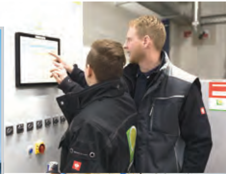
Steirisches Know-how von der H. Traussnigg GmbH für den neuen Fachmarkt Bauhaus Völs

Gerade bei Großprojekten sind Spezialisten gefragt, die Know-how, Fachkompetenz und Erfahrung aus zahlreichen Gewerbebauten mitbringen. Das